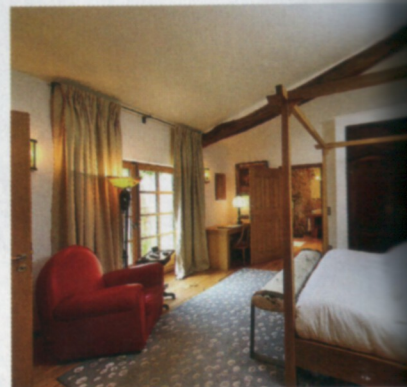
La Bastide de Moustiers, l'exquis repaire d'Alain Ducasse à Moustiers-Sainte-Marie.