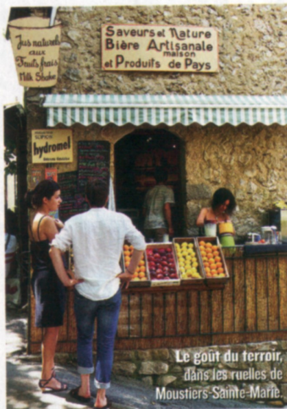
Le goût du terroir, dans les ruelles de Moustiers-Sainte-Marie.

Accrochée à la falaise, traversée d'un torrent scandé de petites cascades, la cité