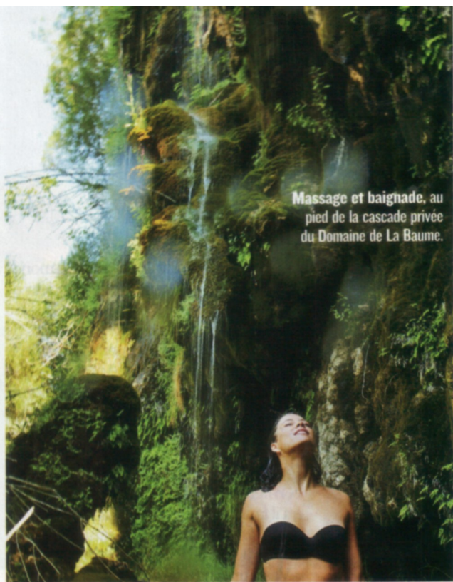
Massage et baignade, au pied de la cascade privée du Domaine de La Baume.