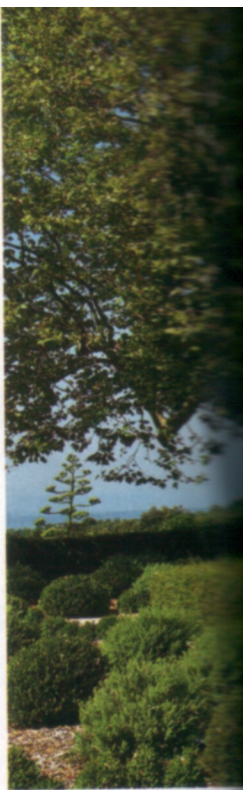
Corse ? Grèce ? Ni l'une ni l'autre ! Le lac de Sainte-Croix offre un dépaysement total.

G iono avait prévenu : « Ici c'est plus que loin, c'est ailleurs » ! Le sentiment de dépaysement est tel que l'on se croirait à des milliers de kilomètres. Et pourtant... Un peu comme dans une célèbre campagne publicitaire pour le tourisme hexagonal, ces paysages sublimes, tous plus exotiques les uns que les autres, ne se trouvent pas à l'autre bout du monde mais bien en France !